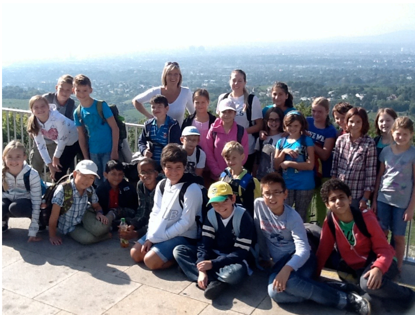
Geringergasse 2, 1110 Wien www.g11.ac.at