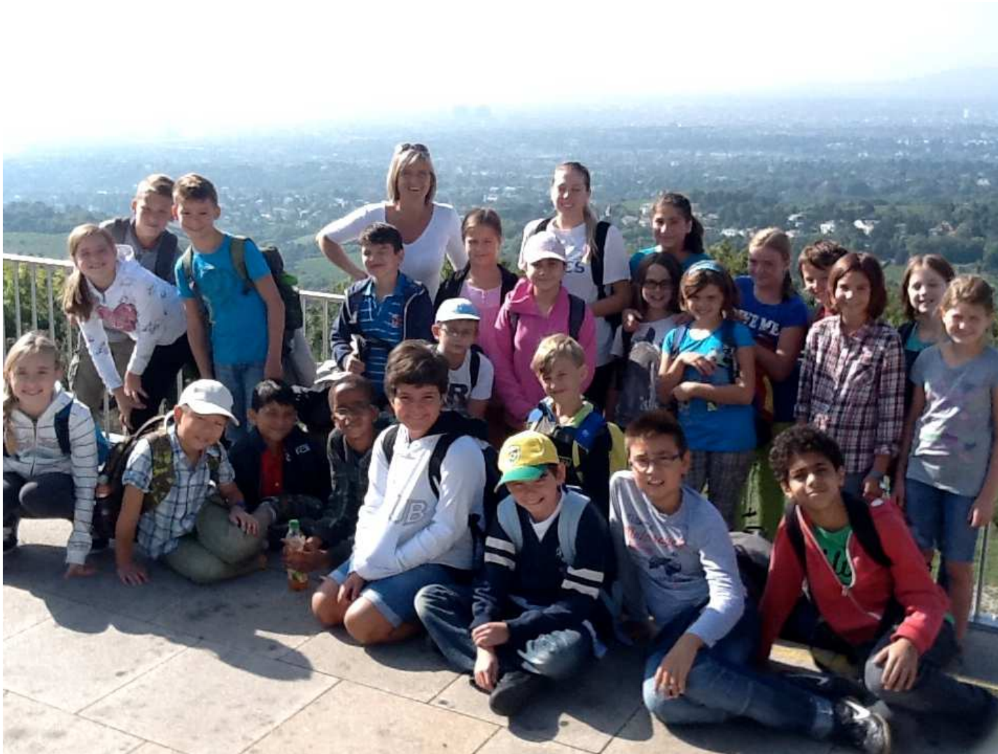
Geringergasse 2, 1110 Wien www.g11.ac.at